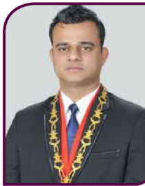
Sen. Shreedhar Basyal National President JCI Nepal(2018)