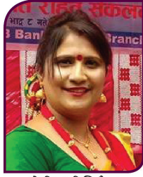
जेसी रश्मी निरौला निरूपित राष्ट्रिय उपाध्यक्ष (सन् २०१८)