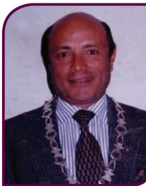
Sen. Dr. Bhekh Bd. Thapa Founder Nation President JCI Nepal