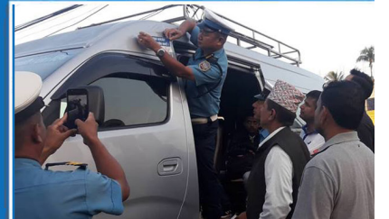
० दुर्घटना न्यून गर्न ५०० गाडीमा स्टिकर, पर्चा वितरण र चालकलाई