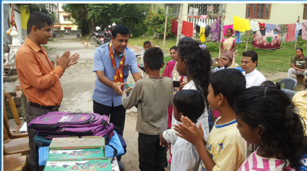
० सन्थाल बालबालिकालाई वीरता जेसीजको सहयोग