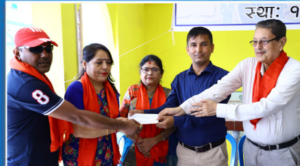
० वीरता जेसीजद्वारा अक्षयकोष सहित दुई पुरस्कार स्थापना